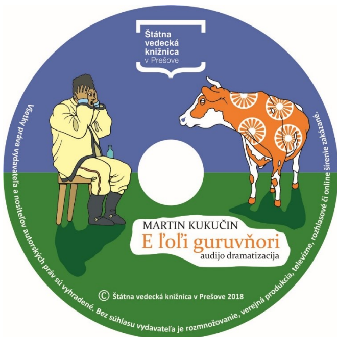
Obrázok 4 CD audio dramatizácie diela Rysavá jalovica