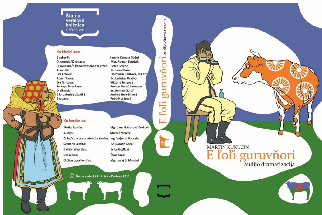
Obrázok 3 Obal CD audio dramatisácie diela Rysavá jalovica