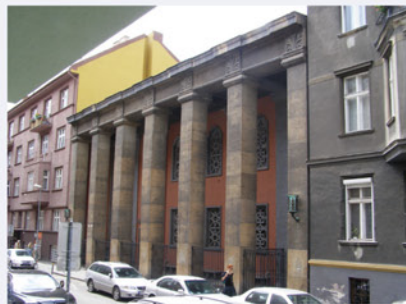
Synagóga, Heydukova 11, vstup o 10:00 a 11:00

Slovenská republika sa pripojila k organizátorom DEKD v roku 1993. Koordinátorom podujatí je od roku 2010 Združenie historických miest a obcí SR. Členským mestom združenia je Bratislava – Staré Mesto, ktoré je hosťiteľom slávnostného otvorenia Dní európskeho kultúrneho dedičstva 2012 v Slovenskej republike. Otváracie podujatia sa konajú v dňoch 14. - 16. septembra. Široká verejnosť má príležitosť spoznať celý rad vzácnych pamiatok, ktoré budú na určitý čas výnimočne sprístupnené.