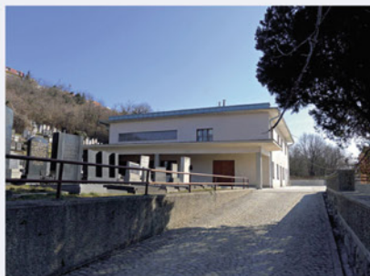
Židovský ortodoxný cintorín, Žižkova ul., vstup o 10:00 a 11:00

Mauzóleum stojí na mieste bývalého židovského cintorína, založeného v roku 1694 a zrušeného v roku 1847. Zostalo iba 23 hrobov a 41 náhrobníkov, medzi nimi aj najvýznamnejšieho rabína Chatama Sofera (vl. meno Mosche Schreiber 1762-1836). V rokoch 2001-2002 bol postavený nový nadzemný objekt mauzólea. Objekt je vysoko hodnotný svojou autentičnosťou, jedinečnosťou, umelecko-remeselnými kvalitami náhrobníkov, ale aj spracovaním detailov a symbolickej novostavby, ktorá technicky chráni torzo pôvodného cintorína.