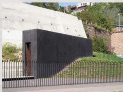
Mauzóleum Chatama Sofera, nábr. L. Svobodu, vstup o 10:00 a 11:00

Objekt bol postavený v roku 1923; projektoval ho architekt A. Szalatnai ako víťaz medzinárodnej súťaže na novostavbu synagógy. Je to dvojpodlažný objekt (prvé podlažie vymedzené mužom, druhé ženám) s progresívnou železobetónovou konštrukciou, postavený za jeden rok. Chránené sú významné architektonické, výtvarné a remeselné prvky, ako empóra s piliermi, obloženie stien, výzdoba stropu modlitebne, zábradlia, okenné mreže, vitrážové okno a ďalšie hodnotné časti mobiliáru.