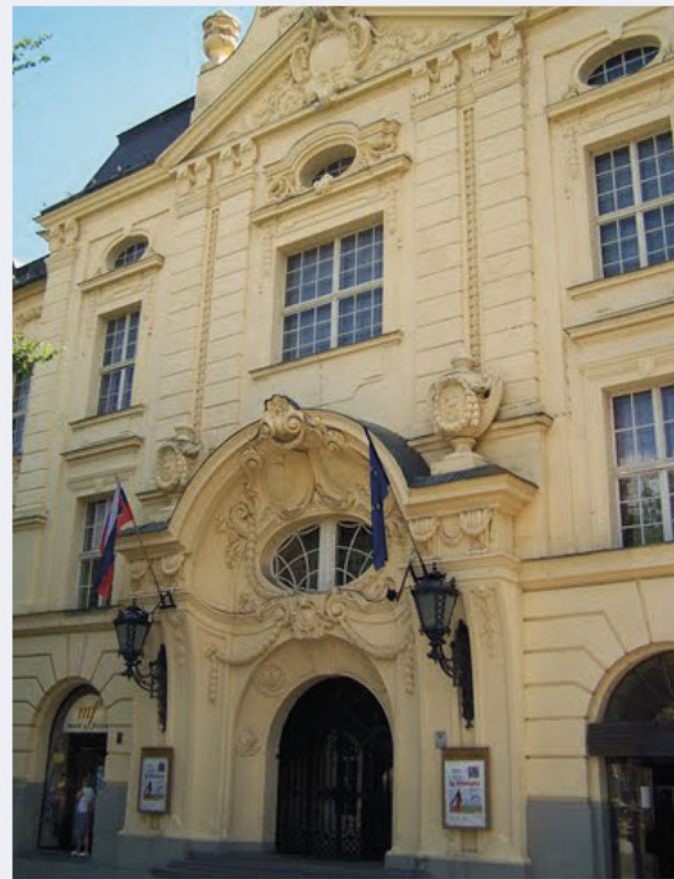
Reduta, Palackého ul. , vstup o 14:00 a 15:00

Palác bol vybudovaný v druhej polovici 19. storočia v eklektickom štýle. Pôsobil tu známy prešporský lekárnik Felix Pisztorý. Počas 2. svetovej vojny tu sídlilo nemecké veľvyslanectvo. V období socializmu tu bolo zriadené Leninovo múzeum a hodnotná výzdoba bola prekrytá propagandistickými úpravami. V súčasnosti staromestská samospráva a o.z. Via Cultura plánujú revitalizáciu objektu.