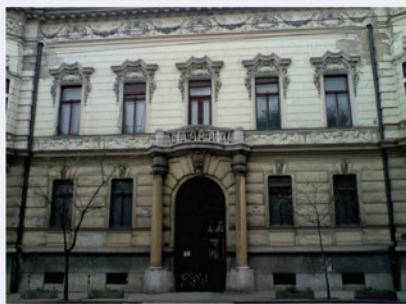
Pisztorého palác, Štefánikova ul. 25, vstup o 14:00 a 15:00 Vernisáž výstavy „Už sme tu, pán Pisztorý“ o 16:30

Židovský ortodoxný cintorín sa nachádza na ploche bývalých Pálffyovských pozemkov mimo pôvodného intravilánu mesta. Cintorín je zachovaný v plnom rozsahu (plocha cintorína od roku 1846 s rozšírením v rokoch 1869 a 1926), s náhrobníkmi, hrobmi a doplnkovými stavbami ako historický doklad svojej epochy. Je svedectvom minulých dôb a jeho kultúrno-historický význam spočíva v estetickú a umeleckú hodnotu náhrobných kameňov, v historickej hodnote náhrobného textu aj v architektonickom riešení umiestnenia, riešenia, stvárnenia a prepojenia stavieb.