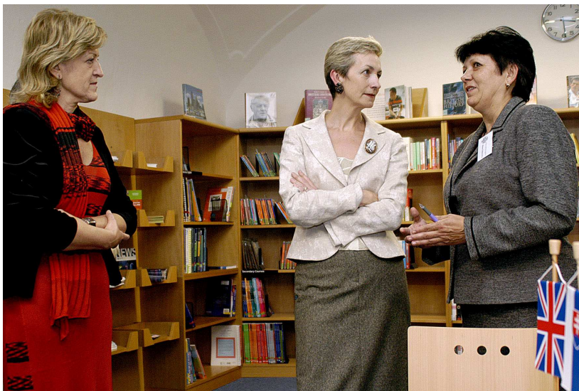
Otvorenie Britského centra

Skúšky všeobecnej angličtiny Cambridge CESOL