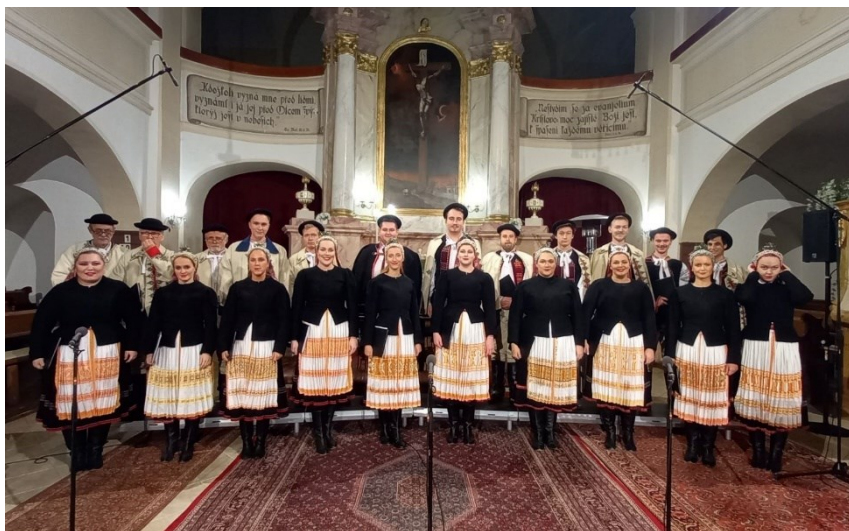
Online adventný koncert, Evanjelický chrám Boží, Myjava, 12.12.2021