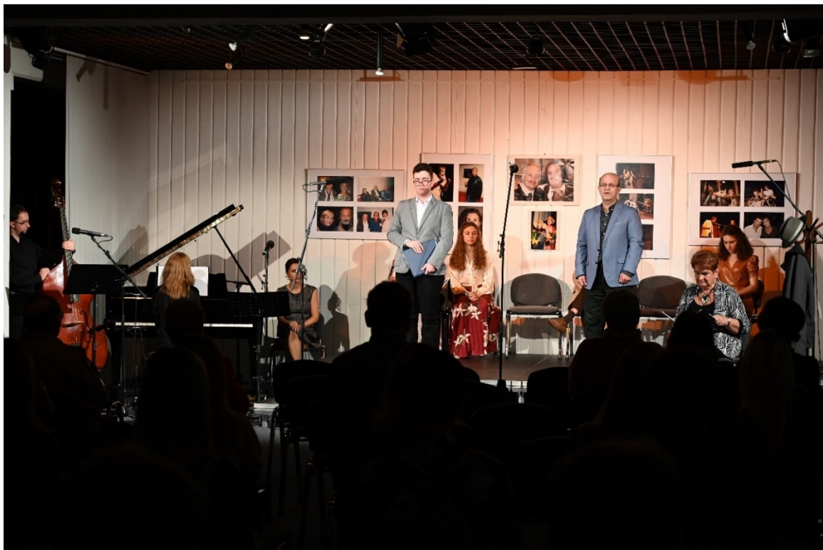
23. ročník Piešťanské rendezvous - Divadielka Galéria pri MsKS Nové Mesto nad Váhom - Ján Smrek - Dnes milujem svoj deň (08. 11.) - hudobno-slovné pásmo