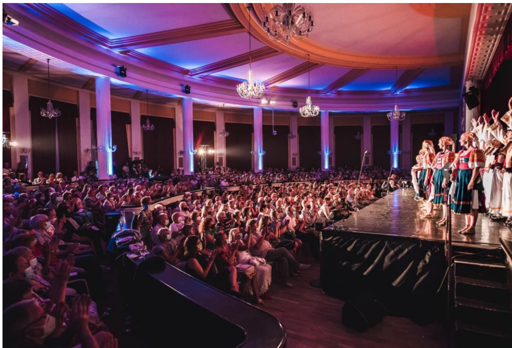
Trenčianske Teplice, 21.08.2021

Počas pandémie sme pripravili prezentačné videá s názvom „ Srdcom Lúčnica “. Ide o tri samostatné videá určené pre zviditeľnenie mena Lúčnice – tak v čase pandémie, ako aj počas nasledujúceho obdobia. Zámerom videí je ukázať členov Lúčnice z iného pohľadu ako ich pozná väčšina ľudí - teda ako tanečníkov a spevákov. Každý jeden člen súboru má, ako i my ostatní aj svoj bežný pracovný, študentský a súkromný život. Cieľom videa je spojiť tieto dva svety – Lúčnicu a súkromie/prácu vybraných členov. Posolstvo videa spočíva aj v tom, že hoci tu máme ťažké časy, základom je nevzdávať sa a vydržať, pričom chceme ukázať, že na zdolávaní týchto prekážok sa výrazne podieľajú aj členovia Lúčnice. Videá sú určené pre šírenie na sociálnych sieťach a v ďalších médiách: