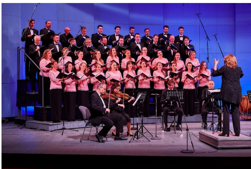
Záznam koncertu v Dome umenia Piešťany, 29.05.2021