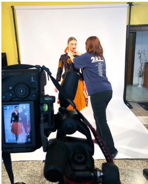
Fotografovanie do archívu krojov Lúčnice

V mesiacoch júl a august v spolupráci s občianskym združením Tanečná škola profesora Štefana Nosáľa úspešne prebehla séria Denných tanečných táborov s Lúčnicou .