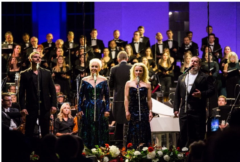
Koncert ABBA/QUEEN, Námestie Zwirn Bratislava, 12.09.2021