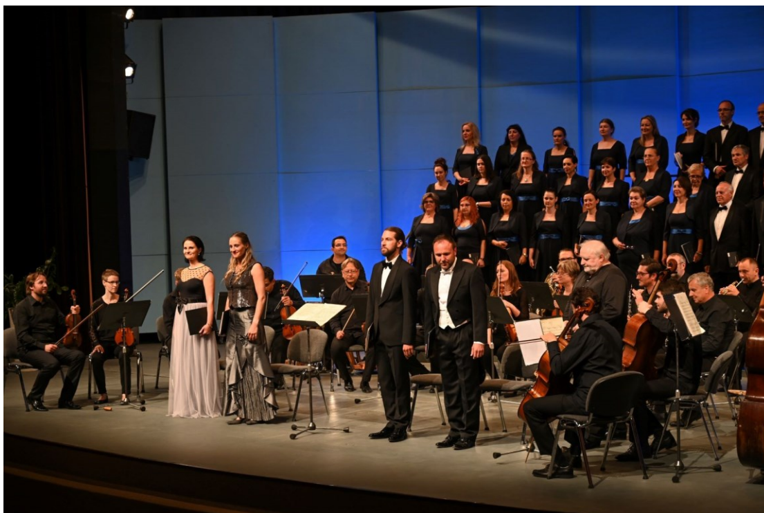
Slávnostný otvárací koncert 66.mfP (04. 06.) – Slovenský komorný orchester, Slovenský filharmonický zbor