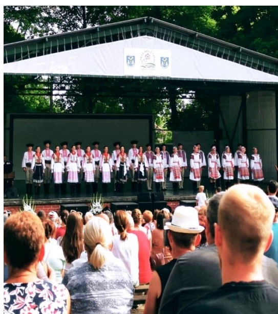
Lúčnica nad Žitavou, 03.07.2021