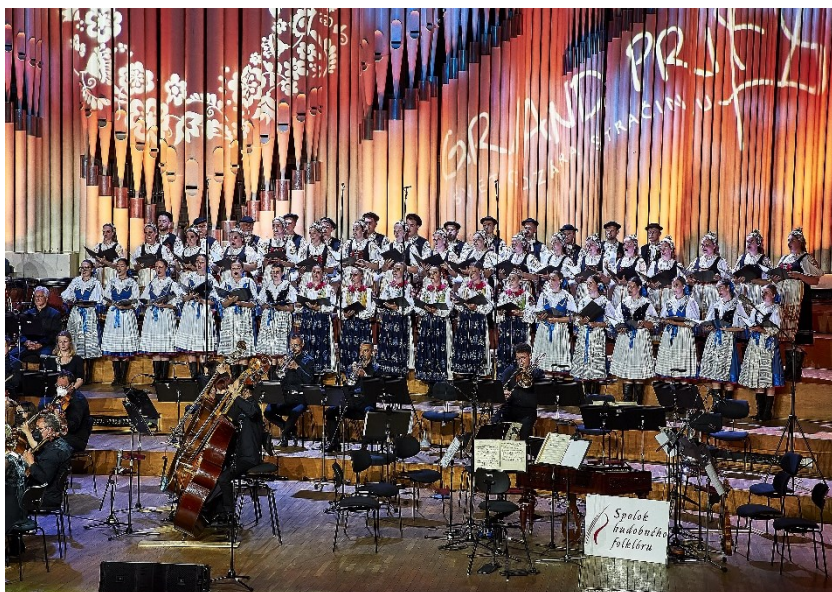
Galakonzert Grand Prix Svetozára Stračina, Veľké koncertné štúdio Slovenského rozhlasu, 12.05.2021